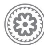
National Bank of Georgia

Η Κεντρική Τράπεζα της Γεωργίας ανακοίνωσε την αύξηση των συναλλαγματικών αποθεμάτων της χώρας τον τελευταίο μήνα κατά 154 εκ. USD, φθάνοντας τα 6,47 δισ. USD. Σε ετήσια βάση, τα αποθέματα αυξήθηκαν κατά 2,15 δισ. USD ή 43% λόγω ανόδου στην αγορά συναλλάγματος από τη Κεντρική Τράπεζα της Γεωργίας, ύψους 2,8 δισ. USD, καθώς και ανόδου της τιμής του χρυσού, που ενίσχυσε τα αποθέματα κατά 343 εκ. USD.